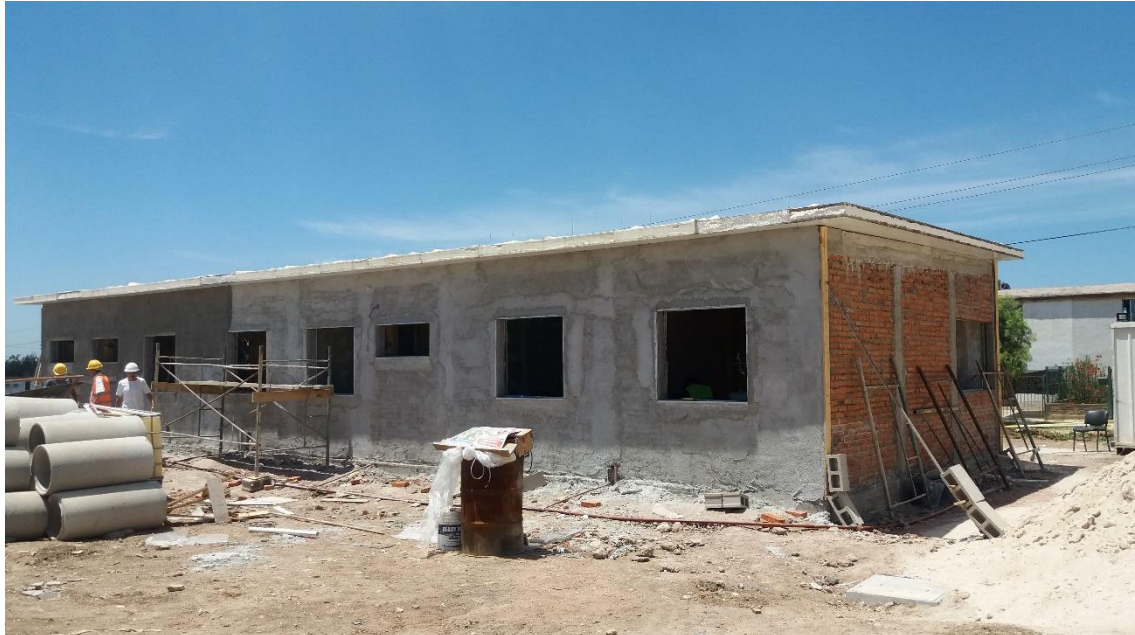
Obra: ASSE Policlínica Pando Metraje: 240m 2 Año: 2016