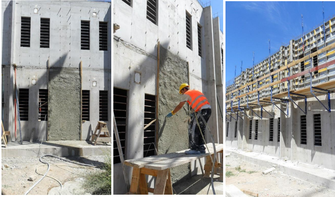
Obra: Comcar Metraje: 4200m 2 Año: 2011