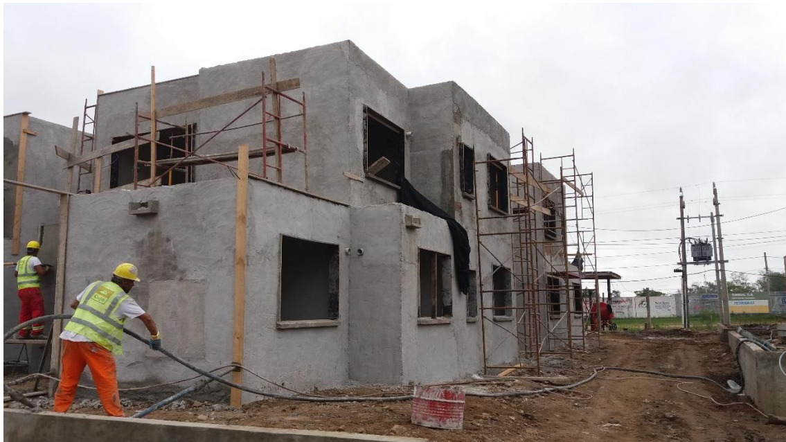
Obra: Casas URU Salto y Paysandú Metraje: 6300m 2 Año: 2012-2016